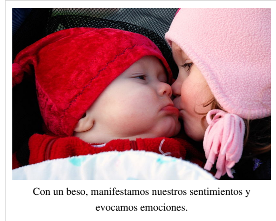
Con un beso, manifestamos nuestros sentimientos y evocamos emociones.