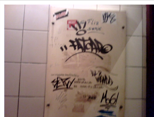
Vandalismos en forma de pintadas. El vandalismo en wikis es otro ejemplo de actuación con perturbación emocional.

Cuando estamos emocionalmente perturbados, solemos decir que «no podemos pensar bien» y permite explicar por qué la tensión emocional prolongada puede obstaculizar las facultades intelectuales del niño y dificultar así su capacidad de aprendizaje. Los niños impulsivos y ansiosos, a menudo desorganizados y problemáticos, parecen tener un escaso control prefrontal sobre sus impulsos límbicos. Este tipo de niños presenta un elevado riesgo de problemas de fracaso escolar, alcoholismo y delincuencia, pero no tanto porque su potencial intelectual sea bajo sino porque su control sobre su vida emocional se halla severamente restringido. [21]